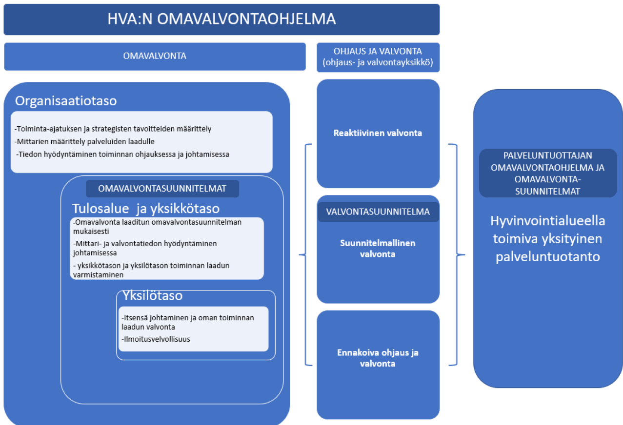
Kuva 2. Omavalvonnan tasot. Kuva laadittu mukailien Satasoten hyvinvointialuevalmistelun omavalvonnan mallia.

Omavalvontaa toteutetaan organisaation jokaisella tasolla. Omavalvontaohjelman kuvaama omavalvonnan kokonaisuus on esitetty kuvassa 2.